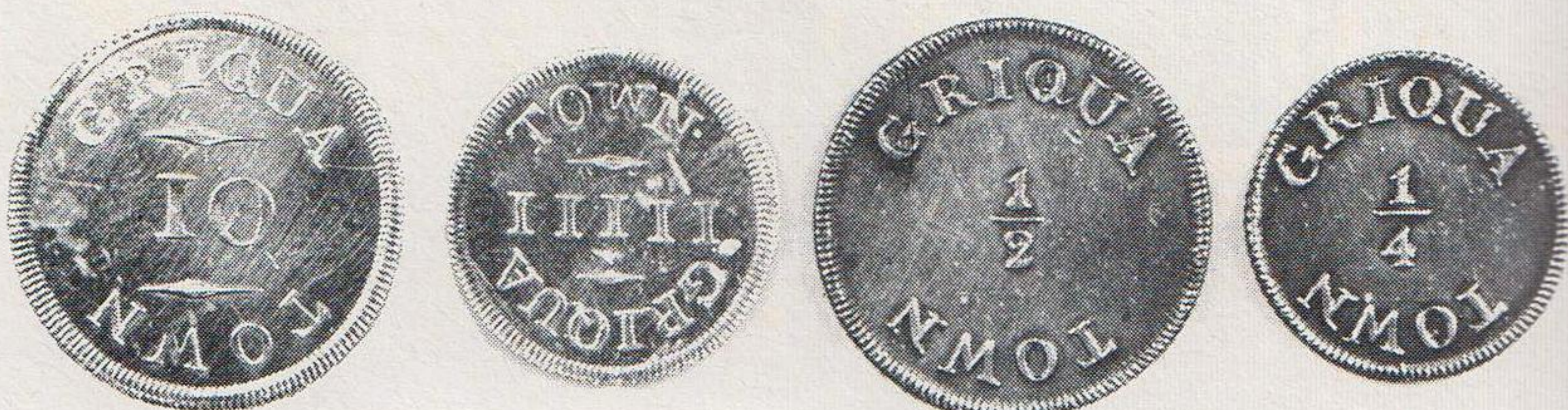
Griekwamunte wat in 1815 en 1816 geslaan is. Die boonste muntstuk toon die aantreklike ontwerp van die voorsy en onder is die keersy van die verskillende munte te sien

EN van die grootste muntversamelings in Suid-Afrika is in die Nasionale Kultuurhistoriese en Opelugmuseum in Pretoria gehuisves. Dit bevat volledige stelle van uiters skaars munte, o.a. 'n stel Griekwa-munte en -banknote waarvan die geskiedenis baie interessant is.