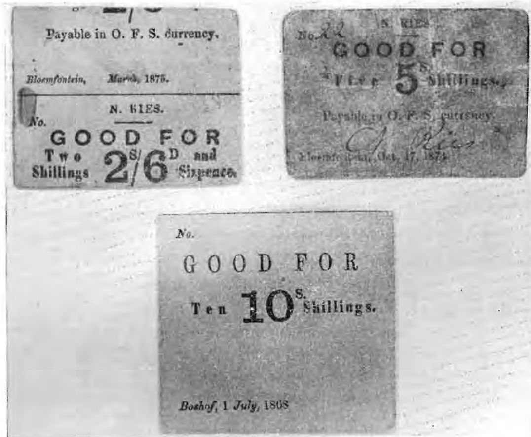
TEKFIGUUR 3. 'n Paar voorbeelde van goedvure uitgereik in die Vrystaat. Ware grootte.